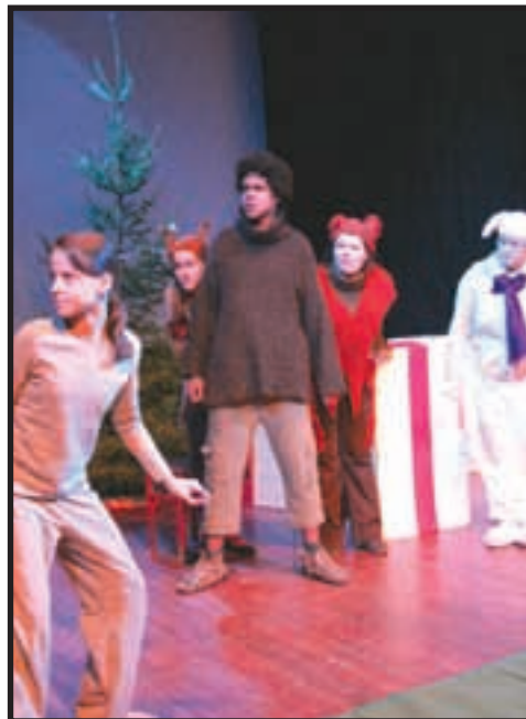
Kuono kohti joulua; Teatteri- ja Sirkuskoulun oppilaiden yhteistyö

Teatteri- ja Sirkuskoulun yhteistyö, tunnelmallinen Kuono kohti joulua –esitys johdatteli katsojat mukavasti