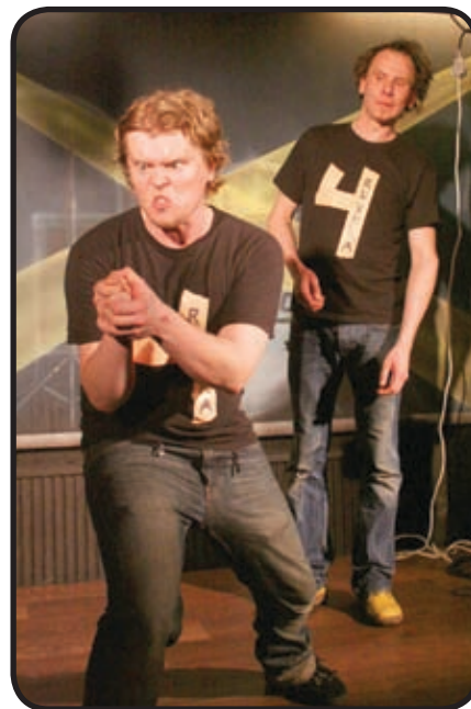
i'mpro2010 festivaali-klubi; Neljän ruuhka gin nuorisopalvelut ja Vantaan kaupungin kulttuuripalvelut sekä Vantaan Sanomat.

Festivaalin yhteistyökumppaneita olivat: Tikkurilan- ja Myyrmäen aluetoimikunnat, Maailma kylässä -festivaali, Työväen Näyttämöiden Liitto, Vantaan kaupun-