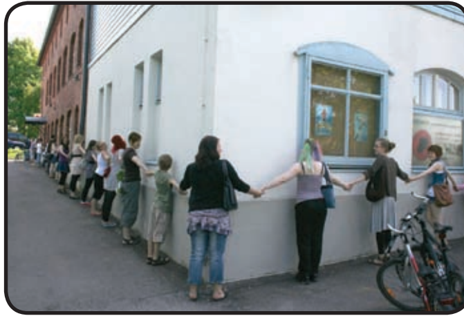
Kevätfestarit ja Vernissan halaus

sa liikuttiin uima-altaan reunalla ja hallin katolla sekä vajottiin alas katselemaan näkymiä altaan pohjalla. Esityksen päähenkilö, nuori lahjakas uimari nähdään päätöksen äärellä: antaa kaikkensa tai lopettaa.