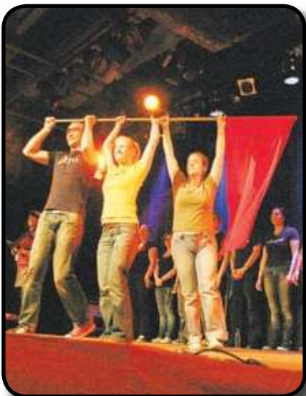
i'mpro2009: Poreen joukkue