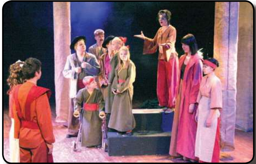
Kaunotar ja hirviö

Upean visuaalinen esitys kertoi kaikkien tuntemaan tarinan yksinäisestä prinsistä, joka oli saanut päälleen kirouksen. Siksi prinsistä oli tullut kaikkien