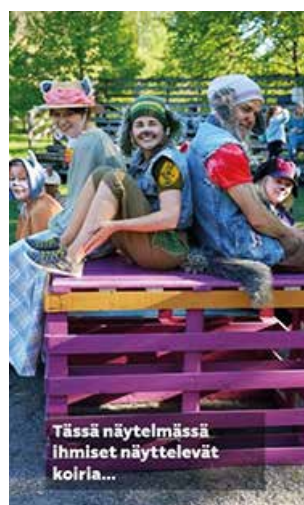
Tässä näytelmässä ihmiset näyttelivät koiria...