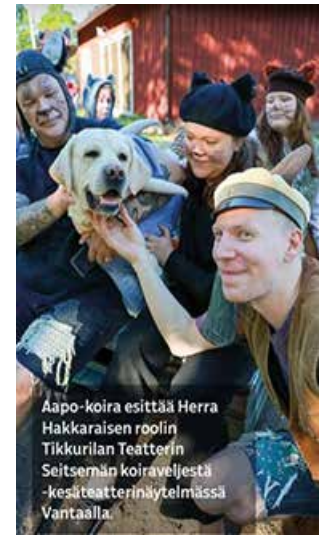
Aapo-koira esittää Herra Hakkaraisen roolin Tikkurilan Teatterin Seitsemän koiraveljestä -kesäteatterinäytelmässä Vantaalla.